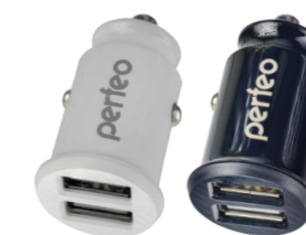
CAR PF_A4459 PF_A4460 С двумя разъемами USB, 2 × 2.4A