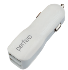
I4614 С двумя разъемами USB, 2.1A.