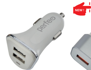
I4616 С двумя разъемами USB, 2.1A.