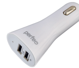
I4606 Для iPhone/ iPad, 1A + 2.1A.