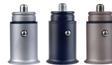
AUTO 2 PF_A4456 PF_A4457 PF_A4458 С двумя разъемами USB, 2 × 2.4A