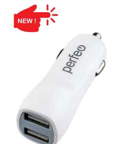
I4624 С двумя разъемами USB, 2.1A.