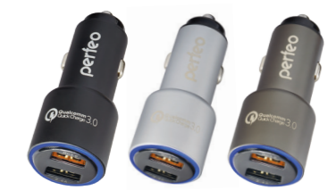
AUTO 2QC PF_A4489 PF_A4490 / PF_A4491 С двумя разъемами USB: QC3.0 – 3A; 2A; 1.5A (quick charge) и Smart – 2.4A