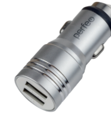
I4612 С двумя разъемами USB, 2.1A, металл.