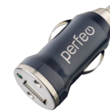
I4608 С разъемом USB, 1A.