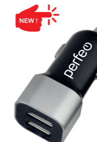
I4620 С двумя разъемами USB, 3.1A.