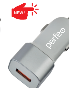
I4618 С разъемом USB, QC3.0 - 3.1A; 2.4A; 2A (quick charge).