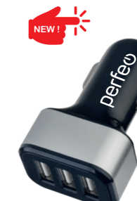
I4622 С тремя разъемами USB, 3.1A.